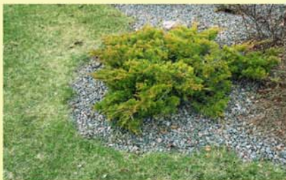
ISTUTUS ILMA ÄÄRISETA

Gardenfixi poolt toodetud peenraäärised sobivad nii olemasoleva kui ka alles loodava ala kujundamiseks.